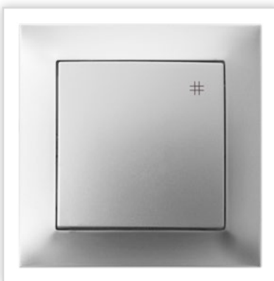
ŁP-1Y/18. Seria podtynkowa IMPRESJA – łącznik jednobiegunowy w kolorze srebrnym. Zalety: osprzęt stanowi doskonały element dekoracyjny, podkreślający charakter wnętrza.