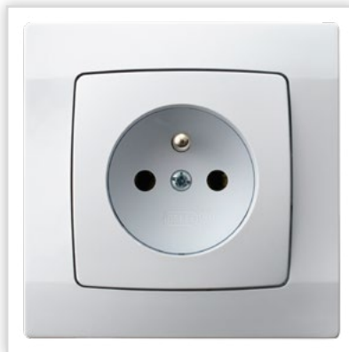
GP-15Z/00. Seria podtynkowa KARO – gniazdo pojedyncze z uzemnieniem w kolorze białym. Zalety: doskonała propozycja dla osób ceniących nietuzinkowe wzornictwo i wysoką jakość.