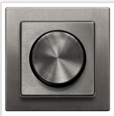
ŁP-8RM/37. Seria podtynkowa SONATA – ściemniacz przyciskowo-obrotowy wykonany ze stali szlachetnej. Zalety: ściemniacz pozwala na dobór poziomu oświetlenia do aktualnych potrzeb użytkownika, co pozwala na zmniejszenie zużycia energii elektrycznej.