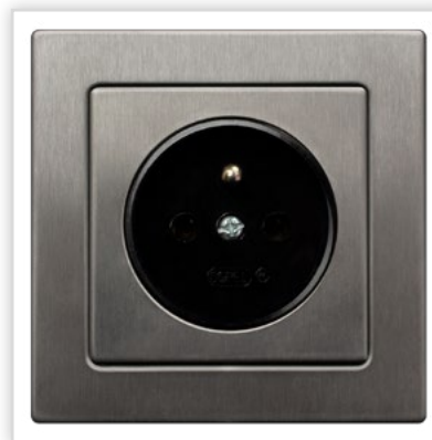
GP-1RMZ/37. Seria podtynkowa SONATA – gniazdo pojedyncze z uziemieniem wykonane ze stali szlachetnej. Zalety: bardzo nowoczesna propozycja, która sprawdzi się przy realizacji odważnych, nowatorskich projektów.