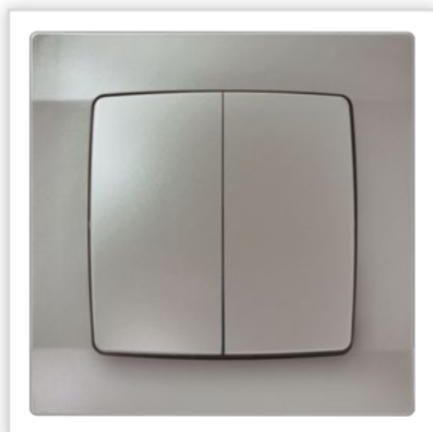
ŁP-25S/43. Seria podtynkowa KARO – łącznik dwugrupowy, świecznikowy w kolorze srebrnym perłowym. Zalety: propozycja musnięta perłowym blaskiem dobrze zaprezentuje się w chłodniejszych stylizacjach. Seria KARO szczególnie polecana jest osobom, które chcą uzyskać nowoczesny czy wręcz futurystyczny charakter kompozycji