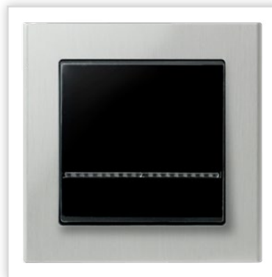
ŁP-1RS/33 z ramką aluminiową. Seria podtynkowa SONATA – łącznik jednobiegunowy z podświetleniem z ramką aluminium. Zalety: idealna kompozycja do wnętrza nowoczesnych.