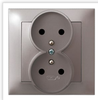
GP-2YZ/23. Seria podtynkowa IMPRESJA – gniazdo podwójne z uziemieniem w kolorze tytanu. Zalety: perfekcyjne dopełnienie nowoczesnego wyposażenia wnętrza o wysokiej jakości wykonania.