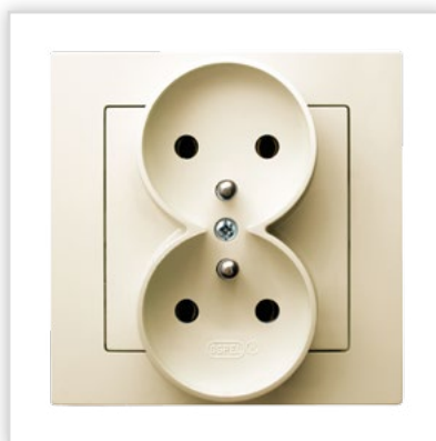
GP-2GRZ/27. Seria podtynkowa AS – gniazdo podwójne z uzemnieniem z możliwością montażu w ramach wielokrotnych w kolorze białym. Zalety: nowoczesne rozwiązanie stanowiące doskonały element zdobniczy.