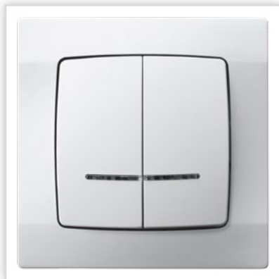
ŁP-25S/00. Seria podtynkowa KARO – łącznik dwugrupowy, świecznikowy z podświetleniem w kolorze białym. Zalety: nawiązuje swoim wzornictwem do najnowszych trendów, stanowiąc kwintesencję nowoczesności i klasyki w jednym.