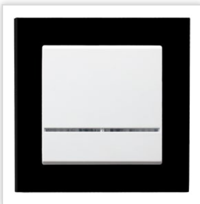
ŁP-1RS/00 z ramką szklaną czarną. Seria podtynkowa SONATA – łącznik jednobiegunowy z podświetleniem z ramką szklaną w kolorze czarnym. Zalety: seria spełni oczekiwania podążających za najnowszymi trendami, urzeknie swym kształtem i elegancją.