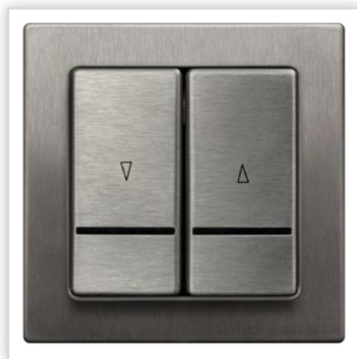
ŁP-7RMS/37. Seria podtynkowa SONATA – łącznik żaluzjowy z podświetleniem wykonany ze stali szlachetnej. Zalety: oryginalny produkt do oryginalnych pomieszczeń – szrotkowana stal podkreśli niepowtarzalny charakter wnętrza