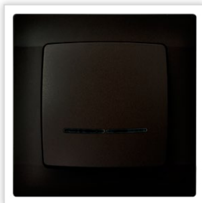
ŁP-15S/40. Seria podtynkowa KARO – łącznik jednobiegunowy z podświetleniem w kolorze czekoladowy metalik. Zalety: metaliczna poświata wydobywa niezwykle głęboką pigmentu, dodatkowo go podkreślając.