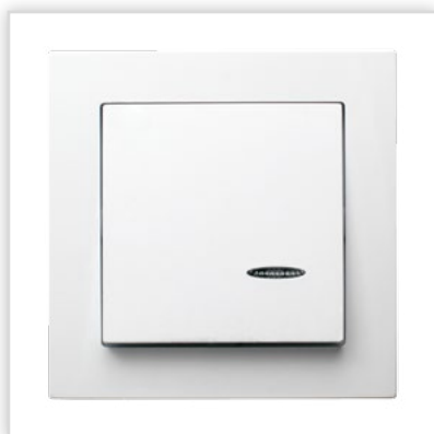
ŁP-1GS/00. Seria podtynkowa AS – łącznik jednobiegunowy z podświetleniem w kolorze białym. Zalety: proste, nowoczesne kształty i stonowana kolorystyka pozwalają na jej zastosowanie w każdym wnętrzu.