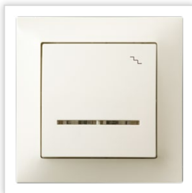
ŁP-3YS/27. Seria podtynkowa IMPRESJA – łącznik schodowy z podświetleniem w kolorze ecru. Zalety: połączenie funkcjonalności z elegancją linią, umożliwiającą zastosowanie produktów zarówno w nowoczesnych jak i klasycznych aranżacjach.