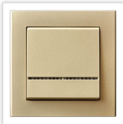
ŁP-1RS/39. Seria podtynkowa SONATA – łącznik jednobiegunowy z podświetleniem w kolorze szampański złoty. Zalety: produkty w tym kolorze idealnie komponują się z wnętrzami i innymi kolorami.