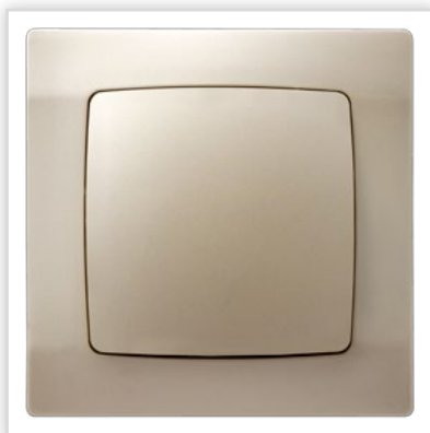
ŁP-15/42. Seria podtynkowa KARO – łącznik jednobiegunowy w kolorze ecru perłowym. Zalety: idealna propozycja dla wnętrz w których prym wiodzie ciepła kolorystyka.