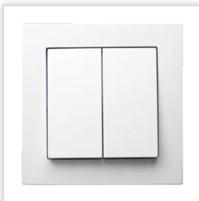
ŁP-2G/00. Seria podtynkowa AS – łącznik dwugrupowy, świecznikowy w kolorze białym. Zalety: połączenie dynamicznego wzornictwa, neutralnej kolorystyki i ponadczasowego designu zapewnia szerokie możliwości aranżacyjne.